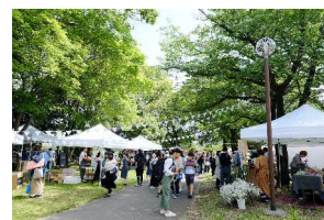
(駅前マルシェイメージ)

概要：麦の生産高全国第2位を誇る福岡県。筑後平野には広大な麦畑が広がっています。そんな筑後地域の麦を使ったパンを主役にパンの美味しさを引き立てる美味しい食べ物と楽しい体験が集まるマルシェを西鉄柳川駅前で開催します。