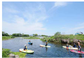
(イベントイメージ)